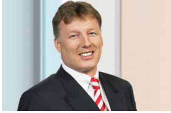
Egbert Tölle, REMONDIS başkanı